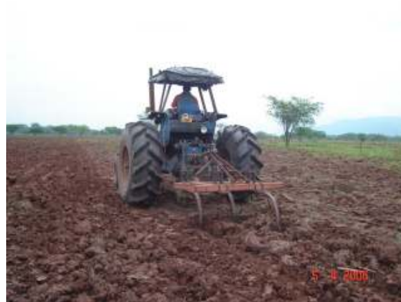
Foto 5. Cincel Vibratorio