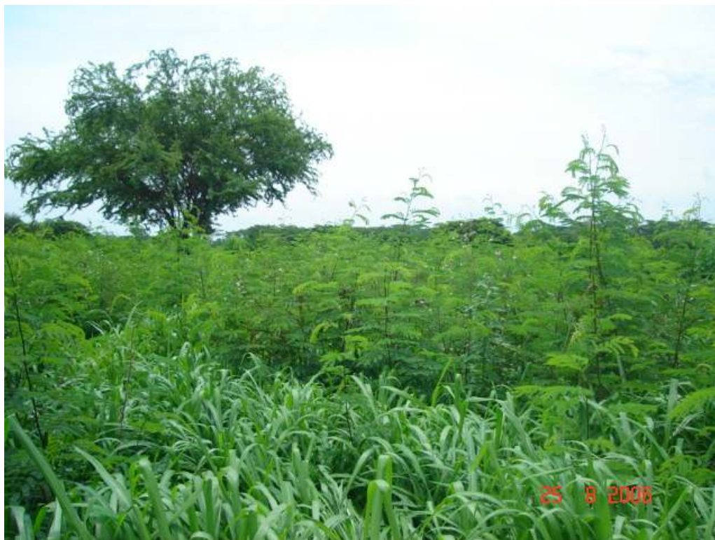
Foto 2. Panorámica del Sistema Silvopastoril Intensivo (SSPi) establecido en Agosto de 2006. (Lote apto para primer pastoreo).

el nitrógeno atmosférico en biomasa vegetal forrajera para los animales tanto en época de sequía como de lluvias, la reducción del efecto negativo de los vientos alisios procedentes de la Guajira en el verano (creando erosión eólica y desecación de la vegetación) y en forma paralela tener el uso inteligente y respetuoso del agua, la restauración y conservación de bosques naturales.