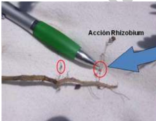
Foto 8. Nódulos de Rhizobium en simbiosis con sistema radicular de la Leucaena