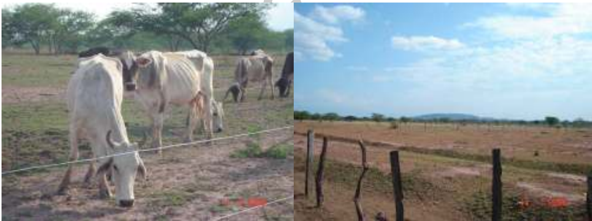
Foto 1. Condición inicial del predio antes de establecer los Sistemas silvopastoriles Intensivos (Baja concición corporal de los animales – izquierda – calvas presentes por el sobrepastoreo – derecha)

El uso de la tierra desde el año 1991 fue destinado para el manejo de ganadería doble propósito en pastoreo rotacional semi-intensivo con baja carga animal y bajos parámetros productivos y reproductivos. En el año 2005 se presenta con un problema de sobrecarga de ganado que ocasiona un sobrepastoreo generando de esta manera un impacto negativo sobre la pradera (pérdida del material vegetal ocasionando calvas por encima del 50 % del área) y los animales (pérdida de la condición corporal, baja reproducción y producción).