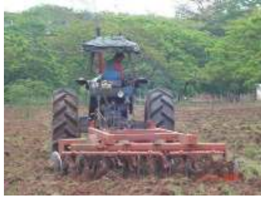
Foto 4. Rastra Pesada