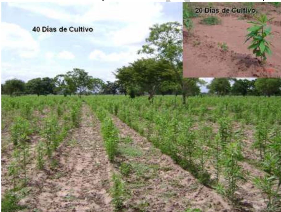
Foto 9. Función de la Crotalaria juncea como marcador del surco de la Leucaena leucocephala

Además de la Leucaena , al mismo tiempo se siembra semillas de Crotalaria juncea (10 % - por cada 10 Kg de semilla de Leucaena 1 Kg de semilla de Crotalaria ). La crotalaria en las primeras etapas de germinación de la Leucaena funciona como tutor o marcador del surco de la misma, esto debido a que la Leucaena en los primeros 45 días de desarrollo es muy lenta en crecimiento y por tal razón va a tener fuerte competencia de arvenses (tanto de hoja ancha como de gramíneas). La acción de marcador o de tutor de la crotalaria , permite labores agrícolas mecanizadas (cultivo de malezas con cultivadoras) sobre la calle del cultivo en los primeros 45 días sin generar daño mecánico alguno sobre la Leucaena . Agregando a lo anterior, luego de que la Leucaena ha alcanzado una altura de 40 ó 50 cm (a los 50 ó 60 días de cultivo), la crotalaria cumple la función como abono verde dentro de los mismos lotes, pues esta se corta a ras del suelo y se ubica sobre las calles del cultivo para que sea incorporada con cultivadoras mecánicas y se descomponga aportando una fuente adicional de materia orgánica. En este momento entonces se procede a realizar la siembra de las pasturas.