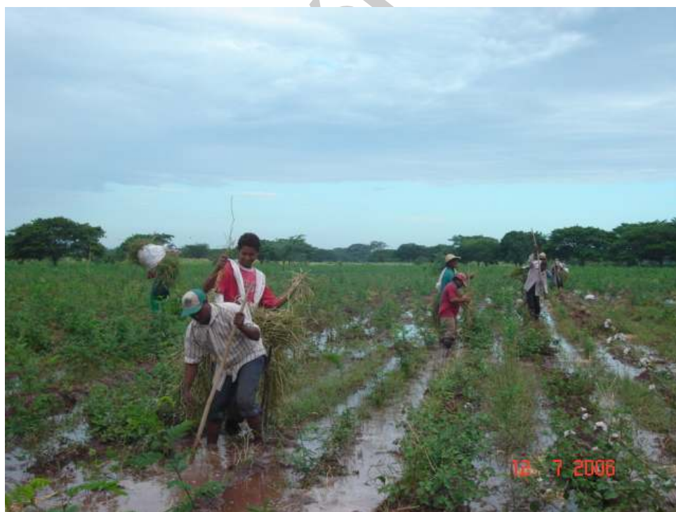
Foto 10. Siembra a chuzo de pasto Estrella

Para el caso de la guinea (TANZANIA), se recomienda utilizar 6 ó 7 Kg Ha -1 de semilla sexual y se siembra al voleo. Las siembras se pueden realizar simultáneamente para evitar la competencia durante su desarrollo.