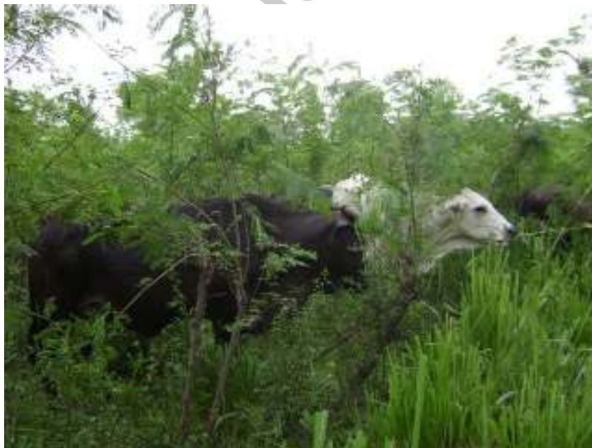
Foto 12. Vacas de ordeño pastoreando en un SSPi

En cuanto al control de malezas, se realiza oportunamente en las épocas de alta precipitación (invierno) donde se desarrollan con mayor fuerza. Sin embargo, bajo el esquema de rotación, el ganado se ve obligado a consumir por igual todos los componentes del sistema propiciando de esta manera un control sobre las arvenses. El control de arvenses va de la mano con las podas. El Porvenir , está realizando entre 2 y 3 podas \text{Ha}^{-1} \text{ año}^{-1} . Las podas se realizan inmediatamente después de que el ganado sale de la franja pastoreada. Las podas se deben realizar con un implemento muy cortante en forma de bisel de abajo hacia arriba para evitar el desgarramiento del tallo y permitir la entrada de hongos que ocasionen la muerte de la planta. El control de arvenses se realiza después de la poda, y solo se controla lo que realmente el ganado no consume.