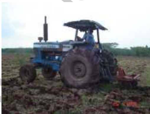
Foto 3. Subsolador Rígido